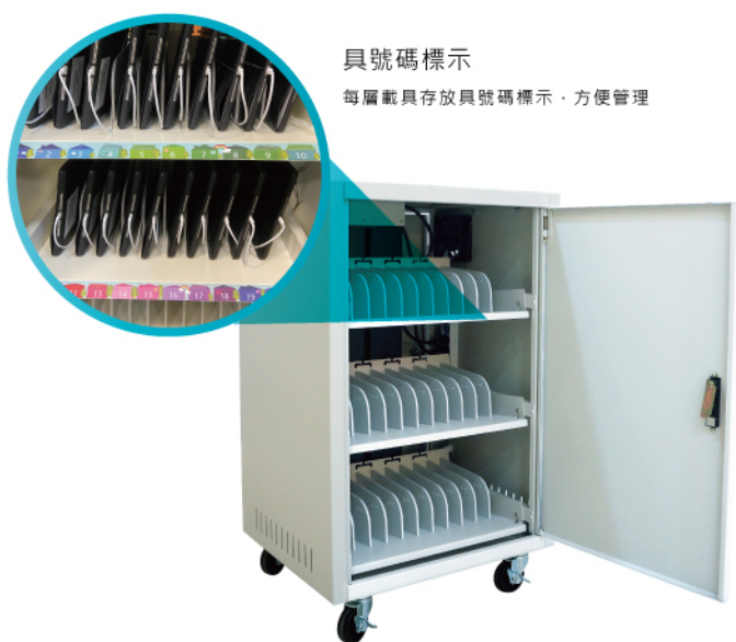
具號碼標示 每層載具存放具號碼標示 · 方便管理